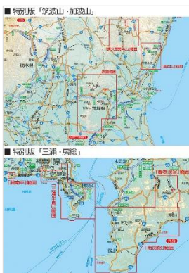
<特別版収録範囲図>

◆特別版「筑波山・加波山」:茨城県のシンボルそして日本百名山の一座でもある筑波山を中心に、加波山、宝篋山等をはじめとする茨城県の主要な山々を収録しています。裏面には日本三名瀑にも数えられる袋田の滝、奥久慈男体山に加え、花の百名山でもある高鈴山エリアを収録しています。