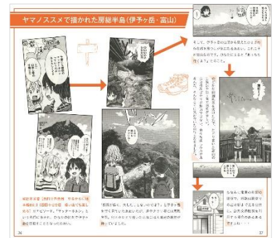
<電子冊子付録イメージ>

◆特別版の発売にあたって、作者ご本人よりコメントが寄せられています。詳しくは6月27日に配信したニュースリリースよりご確認ください。⇒ https://www.mapple.co.jp/19585/