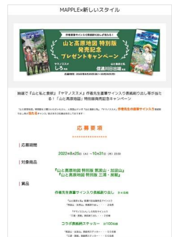
<特設ページイメージ>