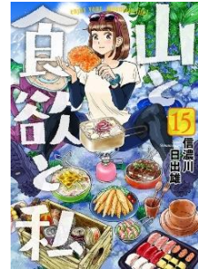
<『山と食欲と私』表紙>

⇒ https://www.comic-earthstar.jp/detail/yamanosusume/