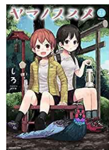
<『ヤマノススメ』表紙>