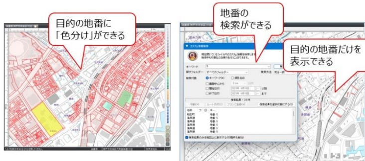
<登記所備付地図データの取り込み後の編集イメージ>