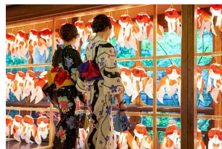
頂上の間「金魚のあかり、未来のひかり」

今年のテーマは「ニッポンのあかり、未来のひかり」と題し、日本五大風鈴や切子、陶芸、月山和紙、琉球ガラスなど日本各地の様々なあかりアートが集結。99段の階段が繋ぐ7つの部屋にて、「まつりのあかり」「ガラスのあかり」「紙のあかり」「木のあかり」「土のあかり」といった全く違う世界観の作品を展開しております。身近で愉しめる非日常体験や夏らしい体験を求めて、開会以来多くの方にご来場いただき、「漁樵の間」「草丘の間」「頂上の間」の3つのアート空間は、特に好評をいただいております。