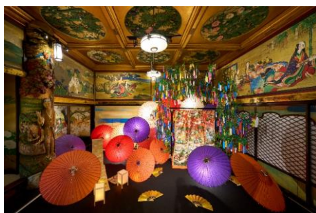
漁樵の間「かぐや姫の記憶」

日本美のミュージアムホテル、ホテル雅叙園東京(所在地：東京都目黒区 / 総支配人：吉澤真一朗)では、2021年7月3日（土）から9月26日（日）までの期間限定で、アートイルミネーション「和のあかり×百段階段 2021～ニッポンのあかり、未来のひかり～」を、館内に有する東京都指定有形文化財「百段階段」にて開催中です。8月16日（月）より、初秋を感じるお月見仕様に一部の展示を変更いたします。また、来場者に人気の3つのあかりアート空間を発表し、その展示品の詳細をご紹介します。