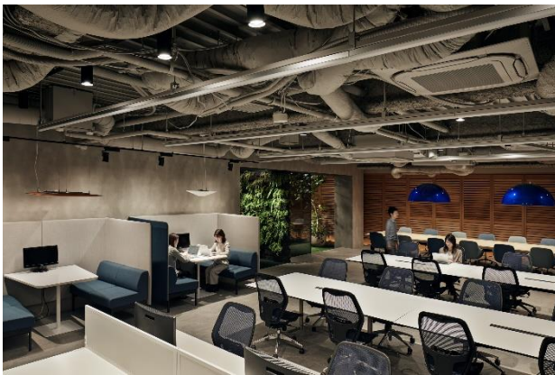
コワーキングゾーン 夕方のシーン