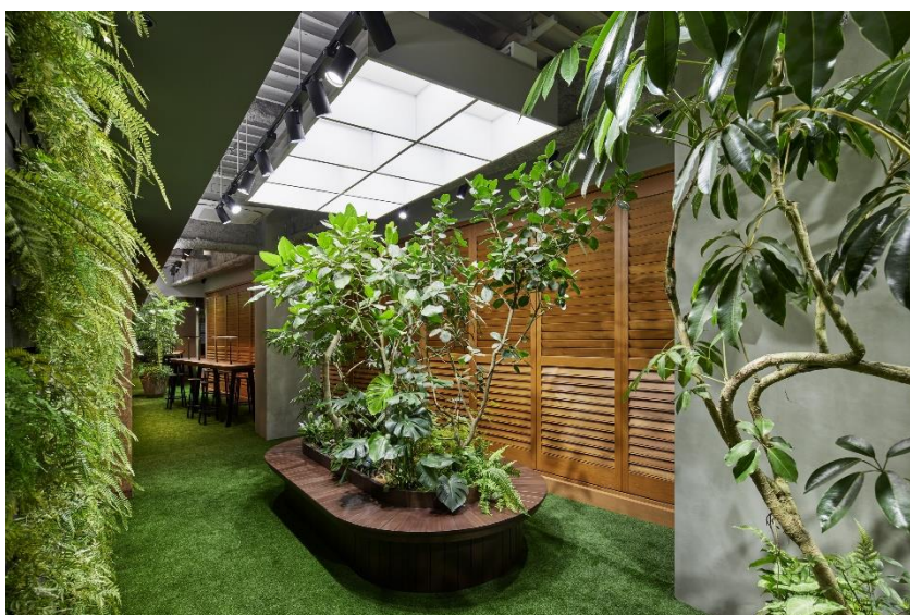
アウトドアリラックス ゾーン