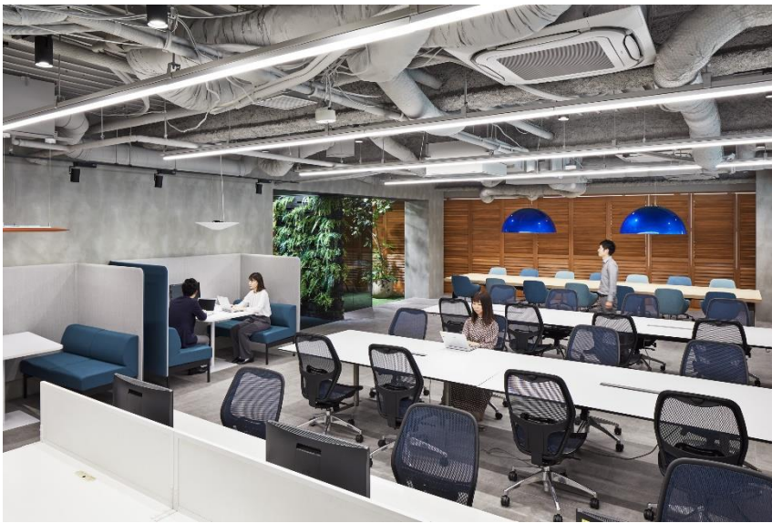
コワーキングゾーン 昼のシーン