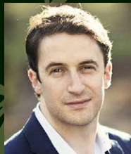
ファ・ベンディックス=バルグリー (Vn)