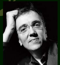
エリック・ル・サーージュ (Pf)