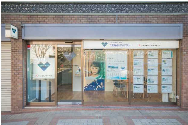
▲ラポルテ西館 1 階 山手幹線沿いの『芦屋営業所』