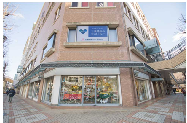
▲ラポルテ本館 2 階 新たに誕生した『芦屋サロン』外観