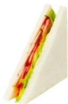
【バジルチキンサンド】

パストラミチキン・トマト・レタスにバジルソースを合わせた、風味豊かでジューシーなサンドイッチです。