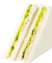
ツナサンド 242 円（税込み）