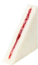
苺ジャムサンド 132 円（税込み）