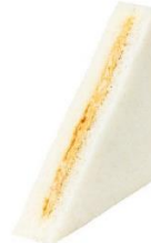
ピーナッツサンド 132 円（税込み）