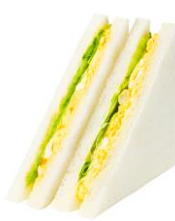
タマゴサンド 242 円（税込み）