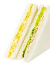
タマゴツナミックス 264 円（税込み）