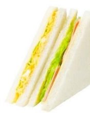
タマゴハムミックス 264 円（税込み）