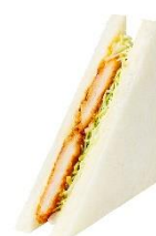
【チキン南蛮サンド～柚子風味～】

チキン南蛮にタルタルソースを合わせてサンドしました。爽やかな和風の味わいの柚子ソースを合わせています。