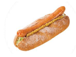
香ばしい全粒粉入りのホットドッグです。 食べごたえのあるジューシーなソーセージが絶品です。