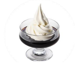
深みのある上品な味わいのコーヒーゼリーに、 コクのあるソフトクリームをたっぷりのせました。