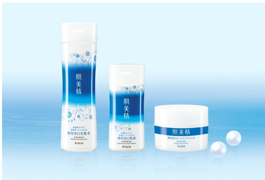
左から 化粧水、乳液、オールインワンジェル