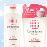
ラメランス ボディウォッシュ フレッシュローズブーケ ポンプ(480mL) 詰替用(360mL)