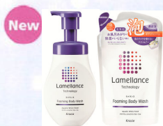
ラメランス 泡ボディウォッシュ アクアティックホワイトフローラル ポンプ(480mL) 詰替用(380mL)