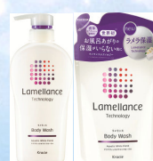
ラメランス ボディウォッシュ アクアティックホワイトフローラル ポンプ(480mL) 詰替用(360mL)