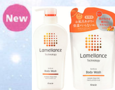
ラメランス ボディウォッシュ アロマティックフラワーリッチ ポンプ(480mL) 詰替用(360mL)