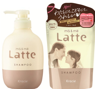
マー&ミー シャンプー