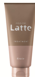
マー&ミー ダメージケア トリートメント

リッチミルクのようなトリートメントで ダメージ集中補修、しっとりやわらかな質感に。