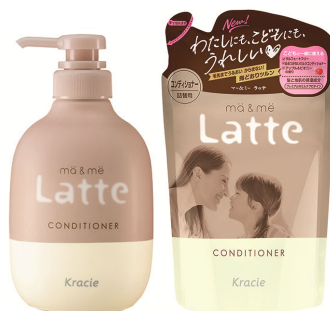
マー&ミー コンディショナー