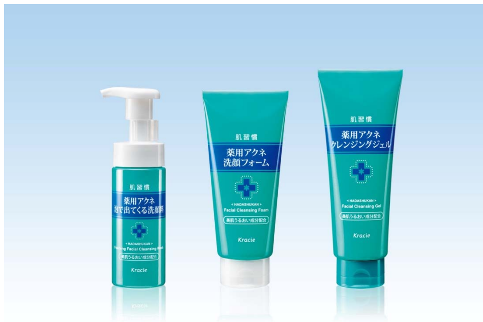
左から「薬用アクネ泡で出てくる洗顔料」「薬用アクネ洗顔フォーム」「薬用アクネクレンジングジェル」。

そこで「肌習慣」ブランドでは、ストレスでニキビがくり返しできる20～30代の女性に向け、ストレスの多い大人の肌を考えた新処方を開発しました。アイテムは、使用シーンやお好みで選べる「薬用アクネ泡で出てくる洗顔料」「薬用アクネ洗顔フォーム」「薬用アクネクレンジングジェル」の3種類です。