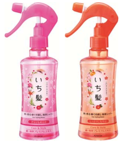
さらりなめらかタイプ(左) しっとりしなやかタイプ(右)