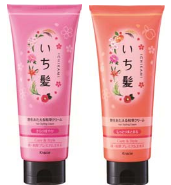
さらり軽やかタイプ(左) しっとりまとまるタイプ(右)

パサつきを抑え、毛先までしっとり。艶やかでまとまりの良い仕上がりです。 ほろ甘いあんずと上品な桜 満開の香り。