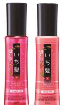
ストレートと和草ミスト(左) ウェーブと和草ミルク(右)

取れかけウェーブもしっかり復活。しっとりとした手触りで、メリハリの効いた艶やかなウェーブが1日中持続します。みずみずしく可憐に咲く山桜 満開の香り。