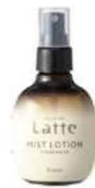
トリートメント ミストローション