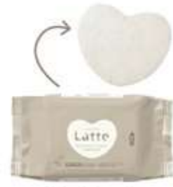
トリートメント エッセンスマスク