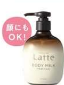
トリートメント ボディミルク