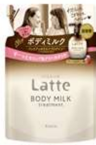
トリートメント ボディミルク 詰替用