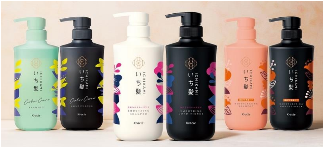
<写真左から:カラーケア&ベーストリートメントライン、なめらかスムーズケアライン、濃密W保湿ケアライン>