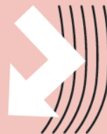
【質感コントロール処方】スタイリング効果×グロス効果

スタイリング効果によって、髪型に沿った面が整いツヤが生まれる 面で光を反射することで、ツヤを感じることが出来る グロス効果によって、より強くツヤが出る