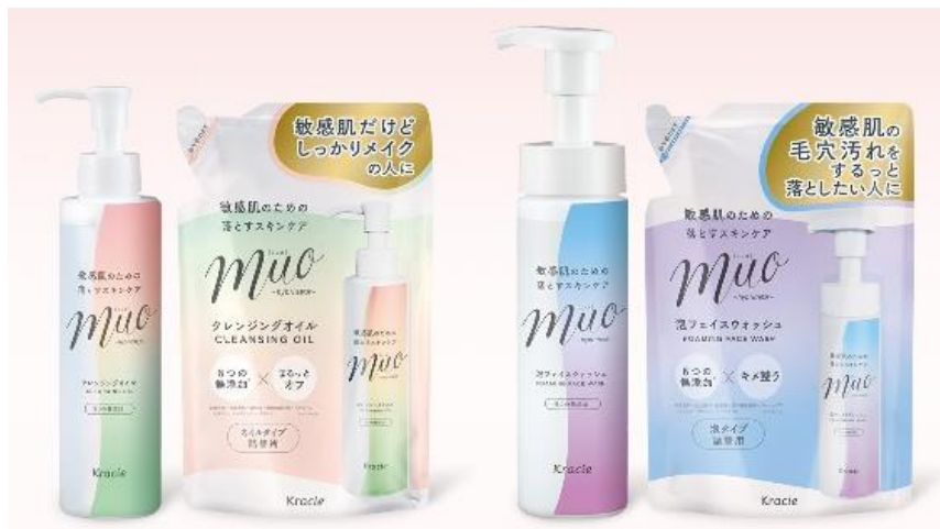
<クレンジングオイル>