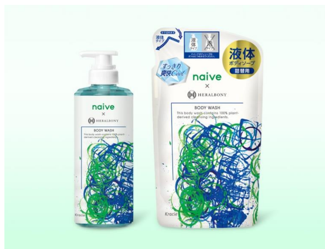
<左から：ポンプ、詰替用>