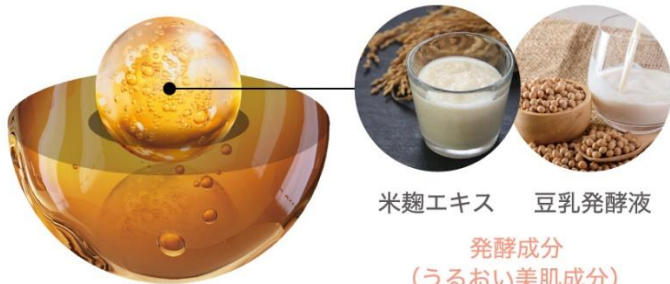
リポソーム発酵ドリップ™