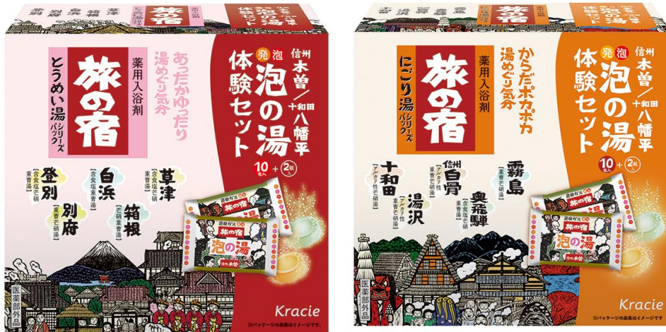
<左から、とうめい湯&泡の湯体験セット、にぎり湯&泡の湯体験セット>

クラシエホームプロダクツは、薬用入浴剤「旅の宿」から「泡の湯体験セット」2種を、2021年9月17日（金）に数量限定で発売いたします。