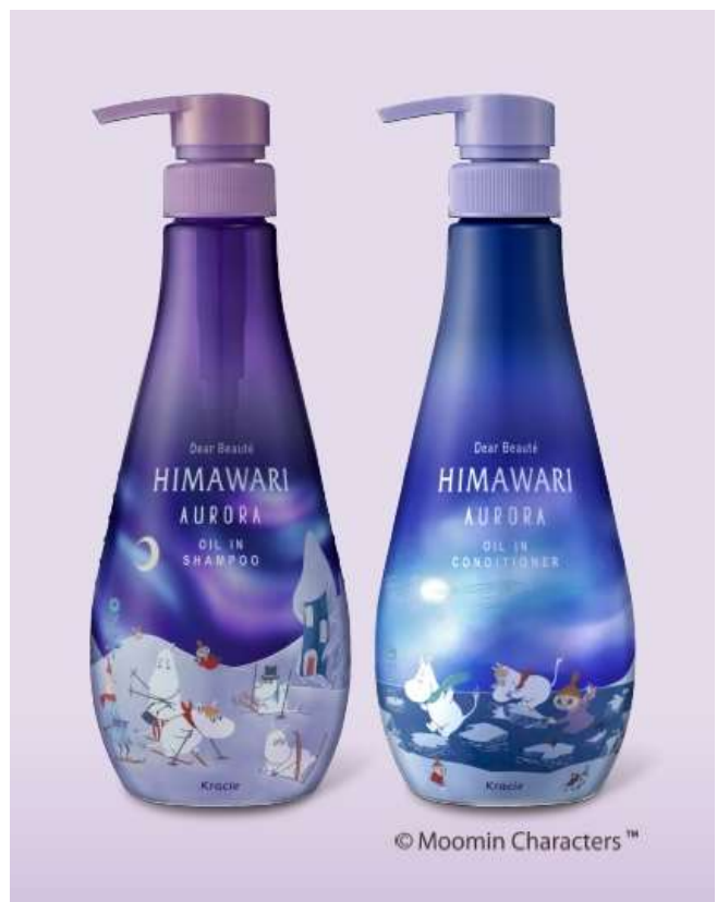
<左から、「スカンジナビアの香り」、「オーロラの香り」>

※1:うねり、くせ、パサつきの原因となっている髪内部と髪の外側それぞれの脂質と水分のバランスの乱れのこと