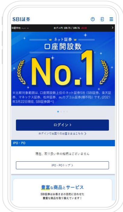
スマホサイトトップ画面