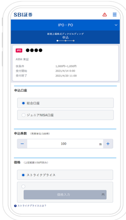
ブックビルディング申込画面