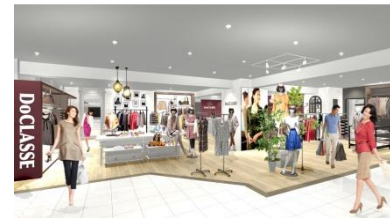
※「DoCLASSE柏店」イメージパース

DoCLASSEの直営店舗はこれまで東京（自由が丘、二子玉川、日比谷、立川）、神奈川、埼玉、千葉、愛知、大阪、兵庫、福岡などに展開し、「DoCLASSE横浜店」は全国で14店舗目の出店となります。