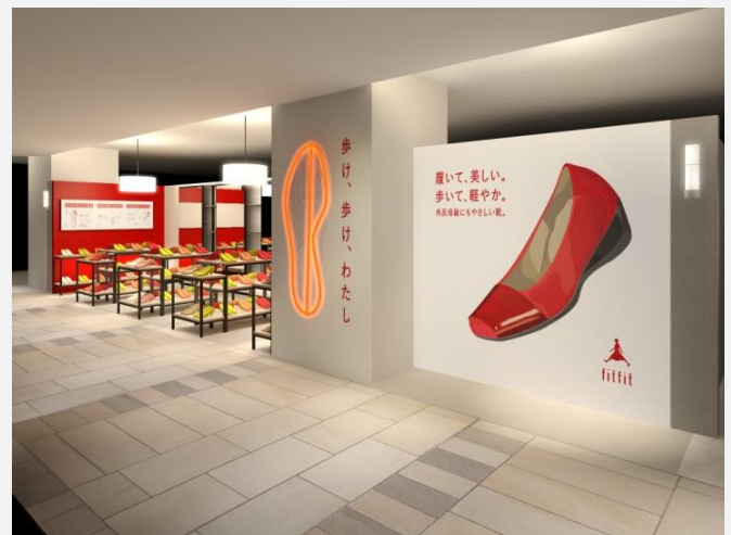
fitfit アトレ吉祥寺店 イメージ