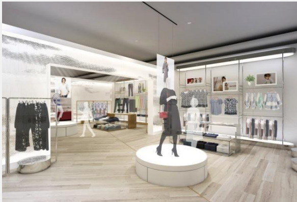
▲レディース店内イメージ