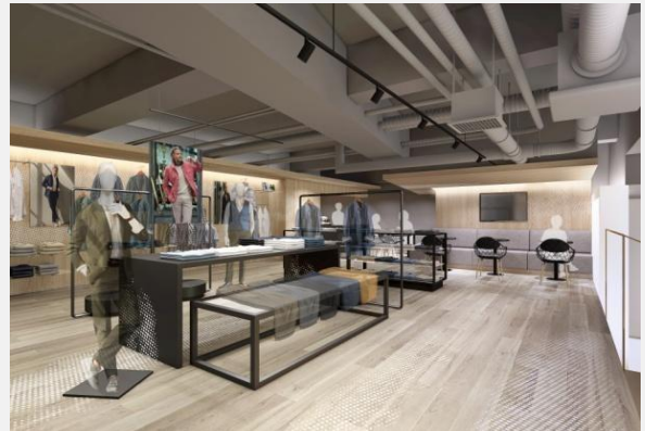
▲メンズ店内イメージ