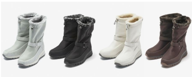
▲(左より)グレー、ブラック、ホワイト、ブラウン