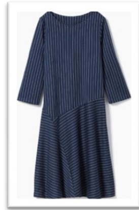
ウールジャージ切替ワンピース/¥7,990

絶妙な抜け感のショールカラーで顔まわりを華やかに引き立て、巻きものいらすの暖かさ。ボーダー幅に変化をつけ、ウエスト周りをほっそり見せてくれる商品。表地はシレー加工でしっかりした生地感と上質な光沢感を。