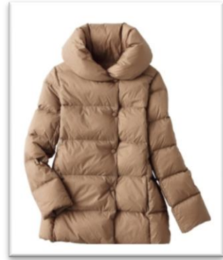
軽量ダウンコート/¥7,990

スリットをいれたタートルネックと袖口は、裏に異なるカラーを配色。素材にはとろみ感のあるレーヨン混ニットを使用し、直接肌に当たっても気持ちのいいなめらかな肌当たり。