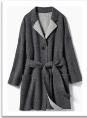
リバーシブルダブルフェイスニットコート/¥12,900

秋冬の街並みに映える淡いトーンで揃えたリバーシブルカラーに、体に沿う自然なAラインのシルエットなどコーディネート力もスタイルアップ力も持ち合わせた商品。高い品質で知られる国内随一のウール産地、尾州産のダブルフェイス生地を使用。