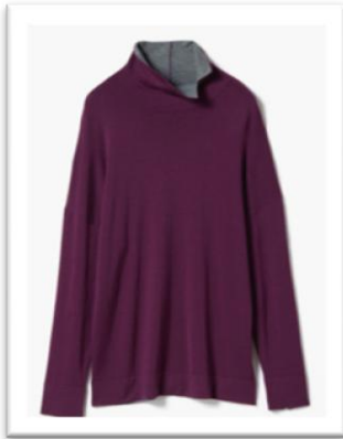
配色ニットスリットタートル/¥3,990

秋冬の街並みに映える淡いトーンで揃えたリバーシブルカラーに、体に沿う自然なAラインのシルエットなどコーディネート力もスタイルアップ力も持ち合わせた商品。高い品質で知られる国内随一のウール産地、尾州産のダブルフェイス生地を使用。