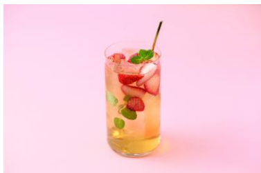
リラクシング・ストロベリー

オリジナルブレンドティー「ロマンス」の華やかな香りにミルクのコクと苺の酸味を合わせた、アニヴェルセルカフェならではのロイヤルミルクティーです。