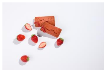
苺のフィナンシェ

自家製の苺ジャムをたっぷり使用し、まろやかな苺の風味と香ばしいバターの香りを一度に楽しめる期間限定のフィナンシェです。