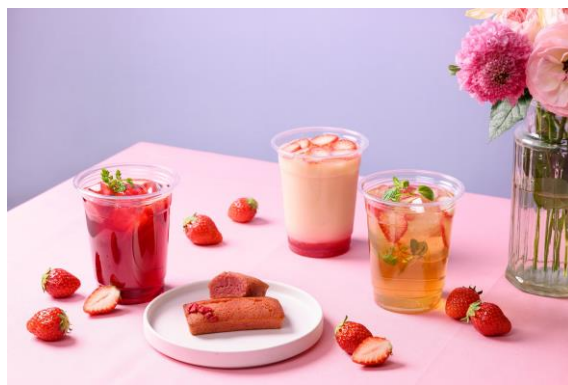
テイクアウトメニュー

テイクアウトドリンクは、イートインとは異なるサイズの専用カップにてご提供いたします