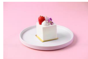
苺のショートケーキ