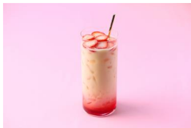
ストロベリー・ロイヤルミルクティー

テイクアウトドリンクは、イートインとは異なるサイズの専用カップにてご提供いたします