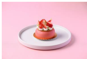
苺とピスタチオのムース

濃厚な生クリームに自家製の苺ジャムと旬の苺を丸ごと1個使用したショートケーキです。あえて表面は真っ白で、苺を中に忍ばせたキューブ型に仕上げることで召し上がる際のワクワク感もお楽しみいただける一品です。