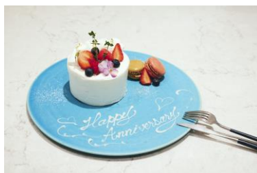
カフェでは夫妻の記念日にぴったりのデザートプレートをプレゼント