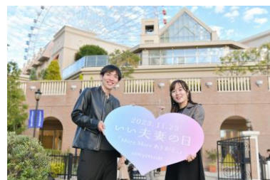
「いい夫妻の日」限定のフォトスポットで思い出の写真撮影