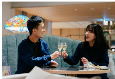
カフェでは乾杯用の シャンパンをプレゼント