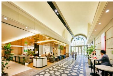
【記念日の館】表参道店を堪能