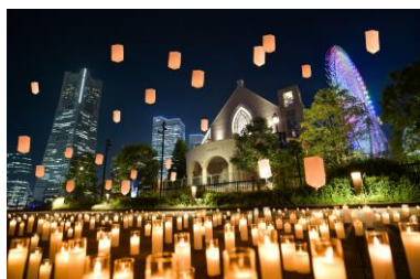
チャペルを無料開放して幻想的なキャンドルナイトを開催