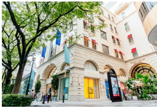
アニヴェルセル 表参道

2023年9月に【記念日の館】としてリニューアルオープンした「アニヴェルセル 表参道」は結婚式をはじめ、カフェやレストラン、コーヒースタンド、スイーツショップ、フラワーショップを展開する記念日の総合施設です。1Fの「アニヴェルセルカフェ 表参道」では、「いい夫妻の日」限定コースをご用意します。プレゼントのシャンパンを楽しみながら、夫妻がともに過ごしてきた日々をお祝いし、普段はなかなか伝えられない感謝の気持ちを交わすひとときをお過ごしいただけます。また最上階の会員制レストラン「TERRASSE」では、11月23日(土)限定で一般開放し、ランチ・ディナーそれぞれ先着10組様にプロカメラマンによる記念撮影付きのコースをご用意いたします。