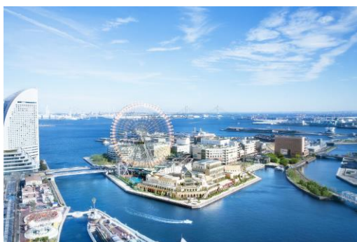
アニヴェルセル みなとみらい横浜

2024年9月に開業10周年の節目を迎えてリニューアルオープンした日本最大級のゲストハウス「アニヴェルセル みなとみらい横浜」では、「いい夫妻の日」を記念してLEDキャンドルの光に包まれる幻想的な「キャンドルナイト」を開催いたします。チャペルを特別に開放し、どなたでも無料でお楽しみいただけます。海沿いの「アニヴェルセルカフェ みなとみらい横浜」では、「いい夫妻の日」限定コースを用意し、みなとみらいの絶景を楽しみながらプレゼントのシャンパンで乾杯していただけます。また夫妻の記念日にふさわしいデザートプレートを、事前にお預かりしたご希望のメッセージを添えてご提供いたします。さらに、観覧車と式場をバックに撮影ができるフォトスポットを設け、思い出に彩りを加えます。