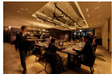
レストランではプロカメラマンの 記念撮影付きコースをご用意