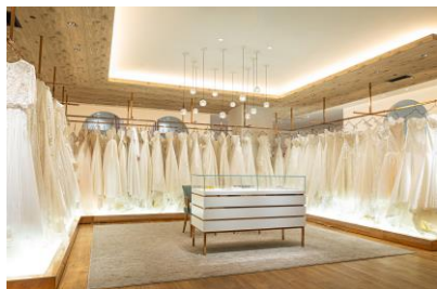
ドレスサロン見学