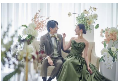
ウェディングスタイル診断