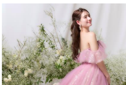
顔タイプ・骨格診断