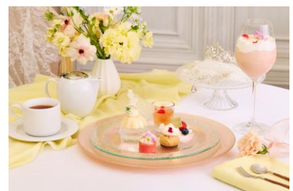
※写真は1名様分です

3段スタンドの世界観を凝縮し、より軽やかなスタイルで堪能できるアフタヌーンティープレートです。ローブ・ド・マリエやロゼシャンパンのジュレなど、パティシエ特製のスイーツ4種を一皿へ贅沢に盛り合わせました。全19種のフリーフロードリンクとともに、本格的なアフタヌーンティーの味わいをカジュアルに楽しみたい方におすすめのプランです。ゆったりとしたティータイムにぜひご利用ください。