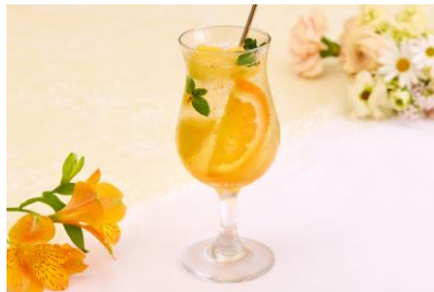
トロピカルヴィネガーソーダ 1,100円（税込）