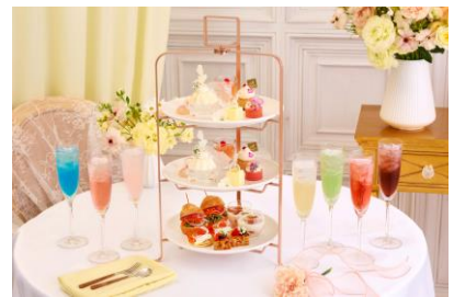
※写真は2名様分です

「Mariée Floral Celebration Afternoon Tea」に、特別な記念日を彩るカラフルなドリンクをセットにした限定プランもご用意いたしました。全7色(青、橙、桃、黄、緑、赤、紫)のラインナップから、お好みのカラーをお選びいただけます。花嫁をテーマにした本アフタヌーンティーは、結婚や誕生日のお祝いはもちろん、推しの誕生日や周年記念、ライブ後のお集まりなど、大切な記念日を華やかに彩ります。3段スタンドの華やかな佇まいと、想いを込めたカラードリンクで、記憶に残る特別なひとときを演出いたします。