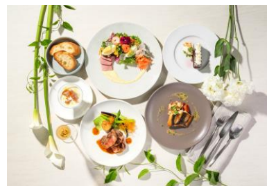
Wメイン全5品のランチコース 5,200円（税込）