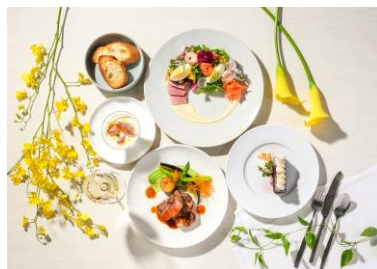
お肉メイン全4品のランチコース 3,900円（税込）

スイーツコレクションに加え、5月1日(金)からランチ・ディナーコースが新たな装いで登場いたします。季節ごとに旬の食材を取り入れたコースメニューを、今回は結婚式場併設カフェならではの祝祭感や多幸感を大切に、一皿ごとのビジュアルや演出により磨きをかけてご用意いたしました。素材の魅力を最大限に引き出した味わいととも、祝福のシーンを想起させる華やかなビジュアルへと仕立て、大切な記念日にもふさわしい特別感あふれる内容へとブラッシュアップ。さらに、ディナーコースのデザートには、本フェアの象徴である「花嫁スイーツ」をご用意いたします。お食事の始まりからデザートの瞬間まで、祝祭感と多幸感に包まれる、心華やぐひとときをお楽しみください。