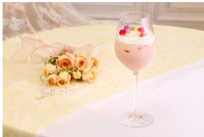
セレブレーションロイヤルミルクティー 1,210円（税込）

陽光きらめく初夏のひとときを色鮮やかに彩る、3種の季節限定ドリンクが登場します。アニヴェルセルオリジナルのロマンスティーを使用した上品な甘さと花嫁をイメージした華やかさが魅力の「セレブレーションロイヤルミルクティー」をはじめ、マンゴーをベースに旬のフルーツが楽しめる「トロピカルヴィネガーソーダ」、苺とレモンの甘酸っぱさをカモミールの優しい香りが包み込む「カモミールベリーティーソーダ」をご用意いたしました。みなとみらいの初夏の景色に映える彩り豊かなドリンクとともに、心ときめくカフェタイムをお過ごしください。