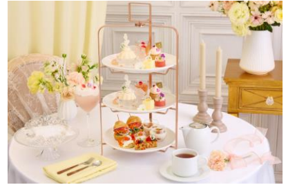
※写真は2名様分です

結婚式場併設のアニヴェルセルカフェならではの「花嫁スイーツ」を各段に配し、花嫁を彩るジュエリーや祝福の花々をモチーフに仕立てた、華やかなアフタヌーンティー。上段と中段には、純白のドレスを纏ったような優美な佇まいの「花嫁スイーツ」を中心に、結婚指輪をモチーフにしたパインムースや、ジュエリーのような煌めきを放つロゼシャンパンのジュレ、そして花嫁を祝福するフラワーシャワーをイメージしたバナラとカシスのクッキーシューなど、色鮮やかなスイーツが並びます。また、3段スタンドへと生まれ変わったことで、世界観をより一層お楽しみいただける構成となり、セイボリーも充実したラインナップをご用意いたしました。旬の食材を活かしたプロヴァンス風キッシュやパリソワールなど、甘味の合間にお楽しみいただけます。全19種のフリーフロードリンクとともに、みなとみらいの景色に包まれながら非日常的なティータイムをお楽しみください。