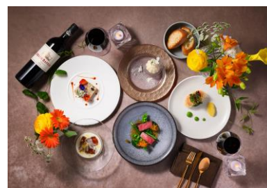
Wメイン全5品のフルコース 7,700円（税込）