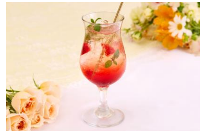
カモミールベリーティーソーダ 1,100円（税込）