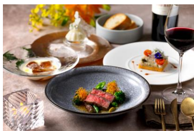
メインが選べる全4品のディナーコース 5,500円（税込）