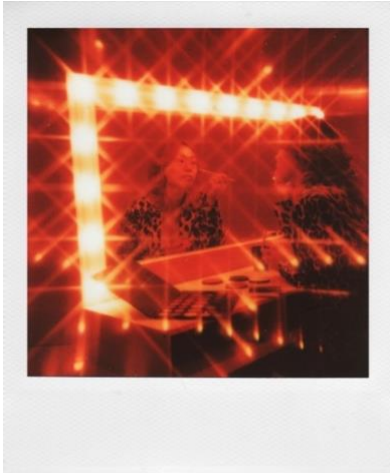
【スターバーストフィルター x 通常撮影】

5種類のアプリ機能と5つのレンズフィルターで、様々な撮影パターンをイメージして1枚のポラロイド写真に閉じ込めましょう。アナログフィルム撮影にもっと遊びの要素を取り入れて、想像力を発揮するチャンスです。アプリを使用しない通常の撮影時にもフィルターを使用することができます。