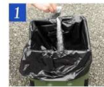
1 排便前に凝固剤を入れる