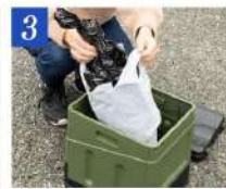
3 ゴミ袋に入れて燃えるゴミとして処分