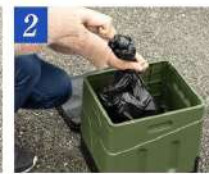
2 排便袋を取り出して口を結ぶ