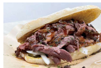
クレージーホース

翌来朝の有機フルーツを味わう。自家製オリジナルドリンクで笑顔あふれるひとときを。