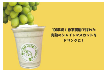
それいけ!すいしょうえん

翌来朝の有機フルーツを味わう。自家製オリジナルドリンクで笑顔あふれるひとときを。