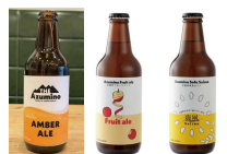
安曇野ブルワリー