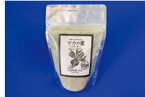
セレクトショップとともに