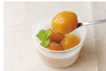
手作り工房 旬な菜

「人と地球に優しい農業」をモットーに低農薬、環境に配慮した農業が育んだ100%リンゴジュースの販売。