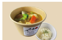
Daddy's soup Azumino

長野県内初!ポンプスープ専門店キッチンカー。信州安曇野より!健康!笑顔を皆様へお届け!