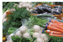
道の駅八王子子湯山