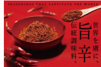
(株)クリエイティブリゾート

辛い中にも旨味あり!一度食べるとまた口にしたくなるテーブル調味料の「すりだね」の販売。