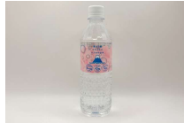
自然の恵み 出張店

国内でも珍しい鮎サンド。鮎釣りの名所でもある上野原市桂川産の鮎の味をお楽しみに!