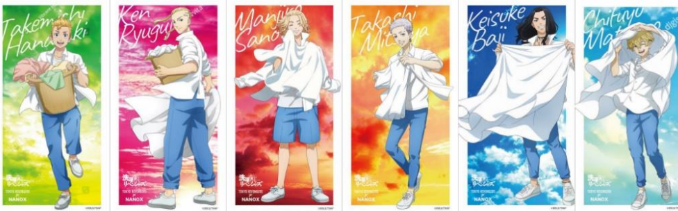
オリジナルステッカー

今回のコラボレーションを記念して、TVアニメ『東京リベンジャーズ』の描き下ろしイラスト使用の限定パッケージ『トップ スーパーNANOX』『トップ スーパーNANOX ニオイ専用』（オリジナルステッカー付き）を発売いたします。また、当商品にはオリジナルステッカーがランダムで1種が付いてきます。タケミチやマイキーなど主要キャラクターたちが洗濯を干している爽やかなイラストとなっています。