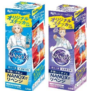
トップ スーパーNANOX 限定パッケージ