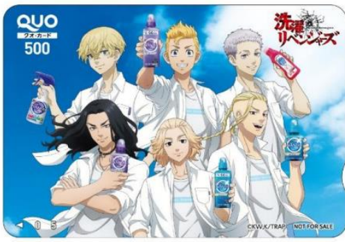
本キャンペーン キービジュアル入りのQUOカード