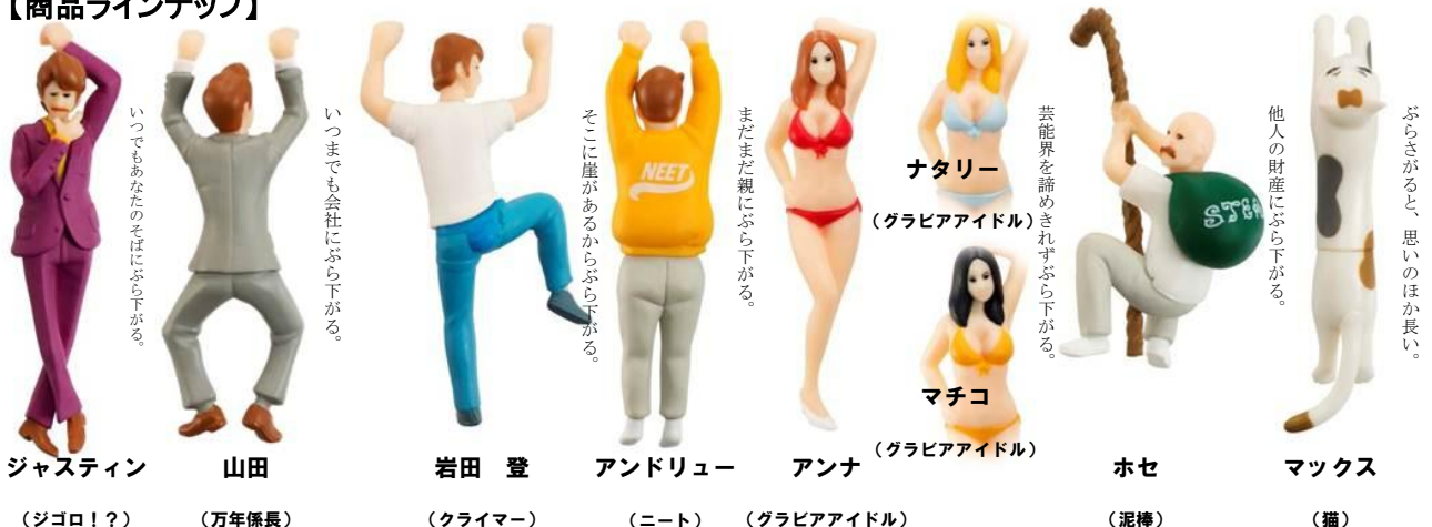
ジャスティン (ジゴロ!?)