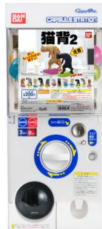
画像:「猫背2」(全12種、1回200円・税込) 左:飾り方イメージ 中:親子で猫背 右:カプセル自販機 ©BANDAI 「ガシャポン」はバンダイの登録商標です。

なお、「猫背」シリーズについて、猫背の専門家である篠原靖治氏にコメントをいただきました。