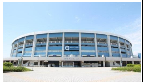
※QVCマリンフィールド