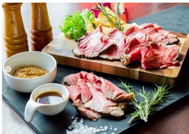
(ローストビーフ 盛り付けイメージ)