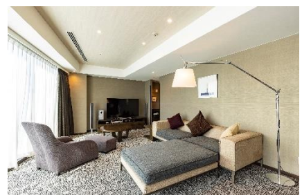
デラックススイート