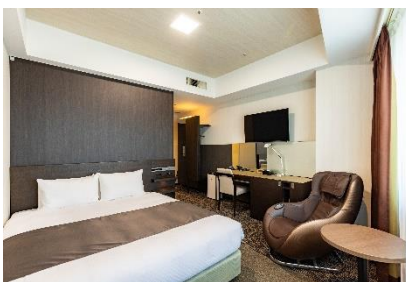
スタンダードクイーン