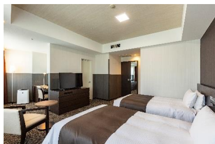
スーペリアツイン