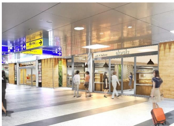
新幹線改札前3階入り口（イメージ）