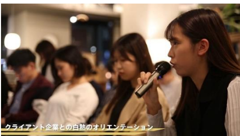
クライアント企業との白熱のオリエンテーション

今回学生がプレゼンした実施案は、プロジェクトに参画する書店企業で検討を行い、採択されたものは今秋以降を目処に実施していく予定です。