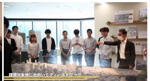
課題対象地に向いてフィールドワーク