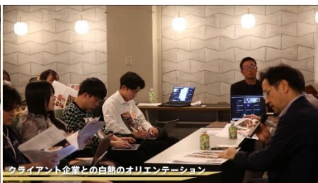
クライアント企業との白熱のオリエンテーション