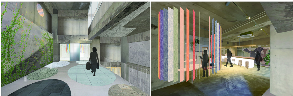
イメージバース：(左) 1F エントランス・(右) フロント・ロビーまわり

東北の新旧を未来へ引継ぎ、多種多様な感性の高いワーカーの欲求を満たす クリエイティブなビジネス・クリエイションの場を提供する新たなライフスタイルホテル。 4月22日 (金) より公式WEBサイトを公開、宿泊の直接予約を開始。