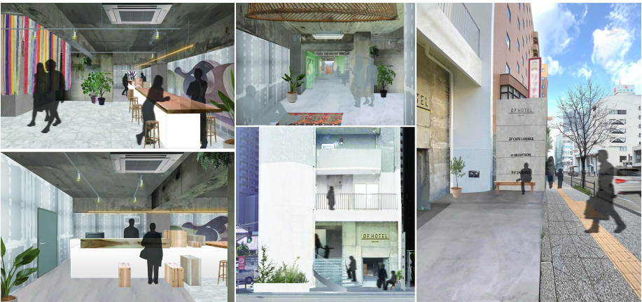
イメージベース：(左上・下) フロントまわり・(中央上) 2F WORKING LOUNGE, COFFEE SHOP, EVENT SPACE (中央下) 外観・正面エントランス (右) 外観サイン・エントランス

「OF HOTEL」公式WEB・予約サイト → https://of-hotel.com/