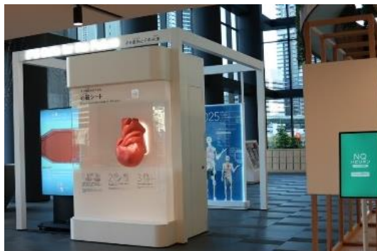
中之島クロス内常設展示

中之島クロスで開始する「DotHealth カラダ測定サービス」は、脳、心血管、髪、筋骨格、肌、歯などの測定結果を総合的に把握でき、生活者が自らの健康をより身近に感じ、日常的な行動変容につなげることを支援します。