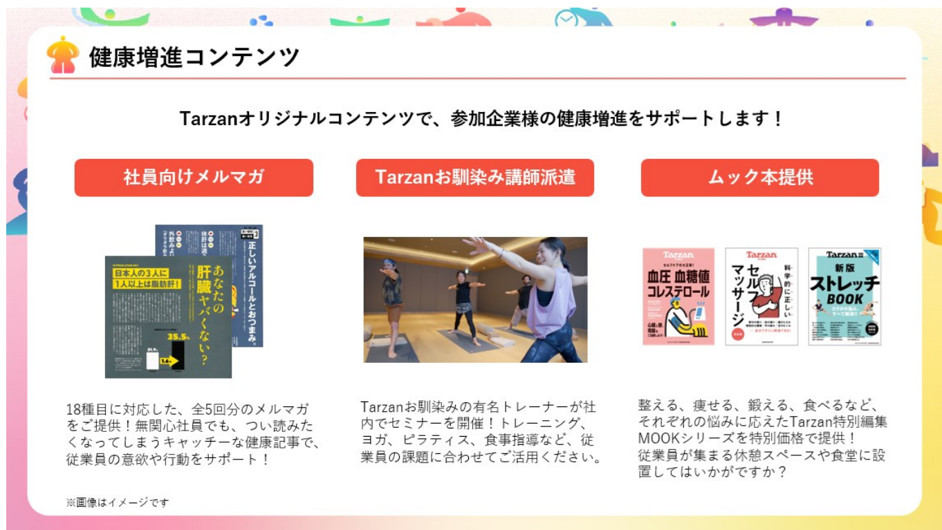
図：Tarzan オリジナルコンテンツの例

健康診断は、多くの人にとってネガティブチェックの場です。今年の数値は問題ないか、心配しながらの受診。楽しいかと言われると、決してそうではありませんでした。そんな健康診断を楽しいものにしようという、ありそうでなかったプロジェクトが『健診グランプリ』です。この道40年、健康的なライフスタイルを提案してきた〈Tarzan〉も、この斬新な取り組みに賛同し、健康志向を加速させるアドバイスに全力で取り組んで参ります。企業ごとの健康個性をもって競う団体戦に至っては、スポーツの祭典を彷彿とさせるワクワクが止まりません。これを機に、社員の皆さまと“健康”を楽しんでいただければと思います。