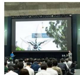
昨年度の会場の様子