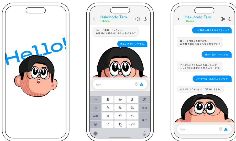
<オリジナル UI イメージ>