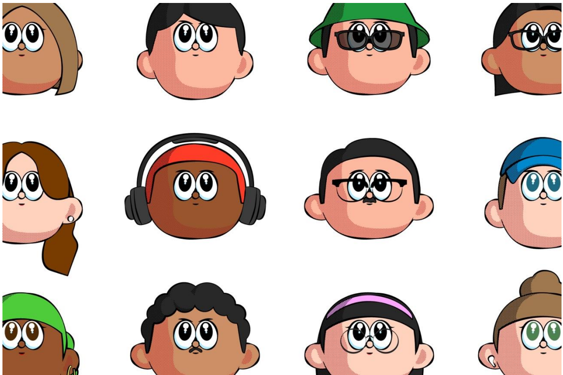
<オリジナルアバター イメージ>

本サービスでは、グローバル展開を意識した博報堂オリジナルのアバターデザインを採用しており、個性的で多様なアバターを再現することができます（ブランドの世界観やニーズに合わせて、アバターデザインをカスタマイズすることも可能です）。さらに、アバターの個性を引き出し、アバターとの対話が楽しくなるような UI/UX デザインにも注力しました。基本機能としては、テキストメッセージでのコミュニケーションに対応しており、応用機能として、音声でのコミュニケーションにも対応可能です。