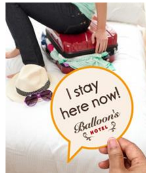
※人や口元にあてて撮ると、より楽しい写真になります。