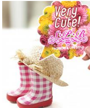
※写真の店名は架空です