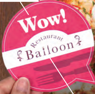
写真1枚で、みんなに 全てを伝達してくれる！