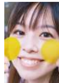
うっとりフェイスイメージ