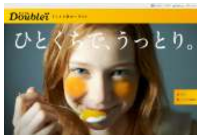
ブランドサイトイメージ

8月20日(火)より、「Doublei(ダブル)」のブランドサイトを立ち上げます。商品情報や、「Doublei(ダブル)」をお試しいただいた方々の“うっとりフェイス”をブランドサイト上で順次公開いたします。